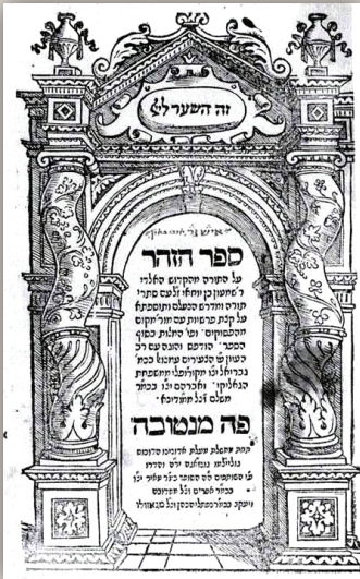
שער ספר הזוהר ◀

בהתאמה מופלאה לתגליות המדעיות המודרניות, כפי שראינו.