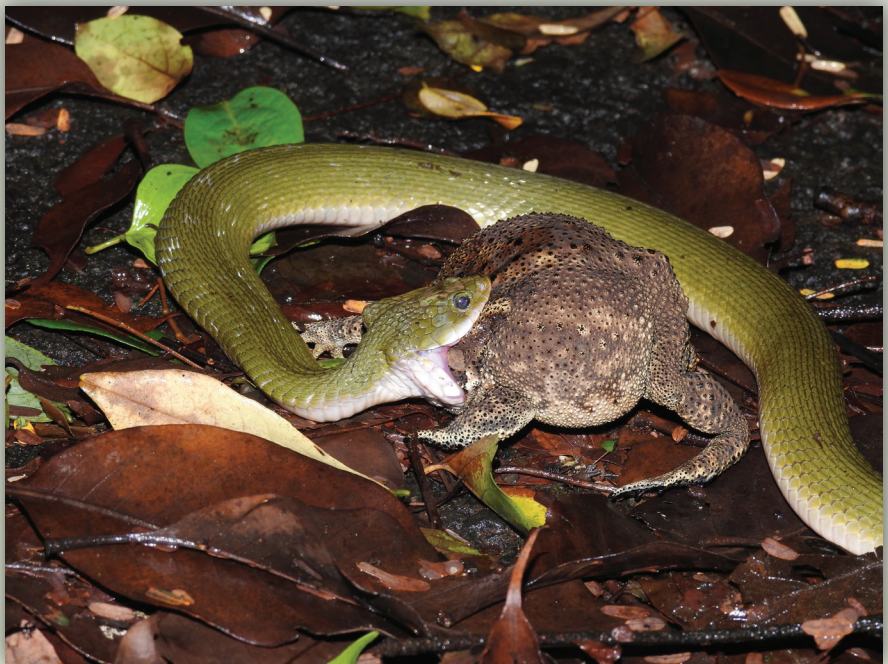
▶ נחש Rhabdophis plumbicolor הירוק ניזון בקרפדה אסייתית ללא אבחנת טעם