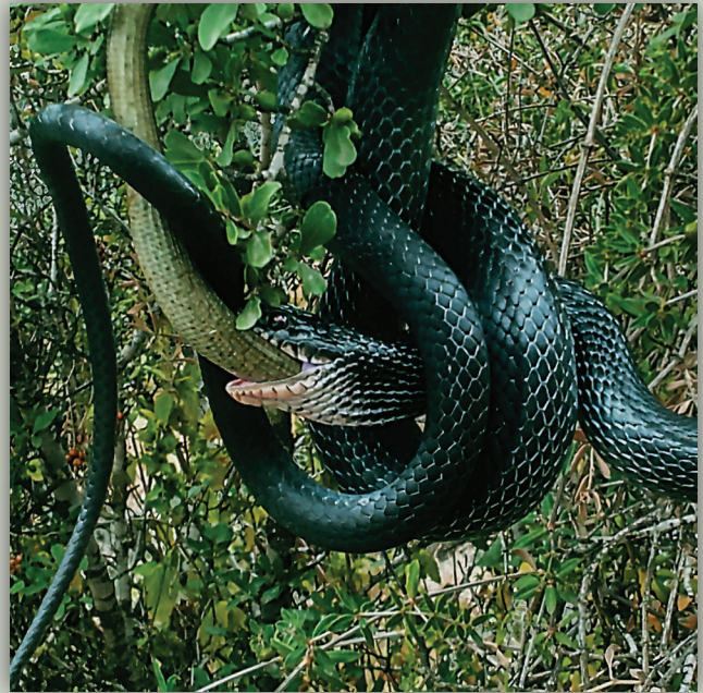
▲ זעמן שחור טורף קמטן חורש צעיר. הנחש אינו מרגיש בטעם הטרף