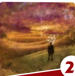
2 הרב דניאל בלס הזכחות לקיום הרוחניות

למדים אנו מכאן את אופן ורמת הסתכלותו של הקב"ה על כל פעולה קטנה שלנו, ואת ריבוי השכר שמעניק עבור כל מעשה