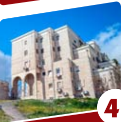
4 הסיפור של ולדר בניך כשתילי זיתים...