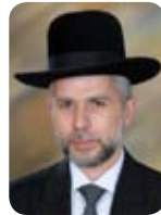
(בראשית יח, ד-נ)

באותן ערים שנפגעו מפצצה כזאת במלחמת העולם השנייה. והטעם שכל מצווה נחשבת בעיני הקב"ה לגדולה וחשובה, היא משום שמידתו של הקב"ה: "רב חסד". וגם "כי הוא ידע יצרנו", ויודע כמה מאמצים נדרש האדם להשקיע כדי להתגבר על יצרו ולעשות טוב. זאת מלבד העובדה שתשוקתו של אב אוהב לתת ולהעניק שפע רב לבנו האהוב על כל מעשה קטן. ולפיכך נותן שכר מצווה ביד רחבה. אשרי אדם יודע זאת ומתאמץ לעשות את רצון ה' בדבר קטן כגדול. שבת שלום.